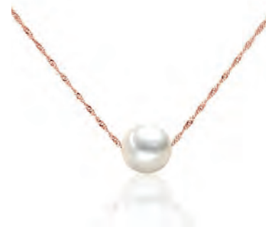
●03 216.0666 750/-RG Collier, Akoya-Zuchtperle, rund, weiß, 8,5 - 9 mm, Länge 40 cm