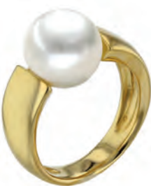
• 13 008.0606 585/-GG Ring, Süßwasser-Zuchtperle, rund, weiß, 10,5 - 11 mm