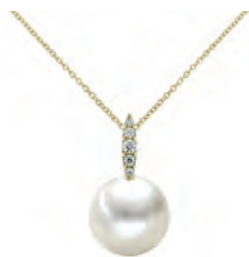
• 01 202.1359 585/-GG Anhänger, Süßwasser-Zuchtperle, rund, weiß, 9 - 9,5 mm, 5 Brillanten H/SI 0,05 ct.