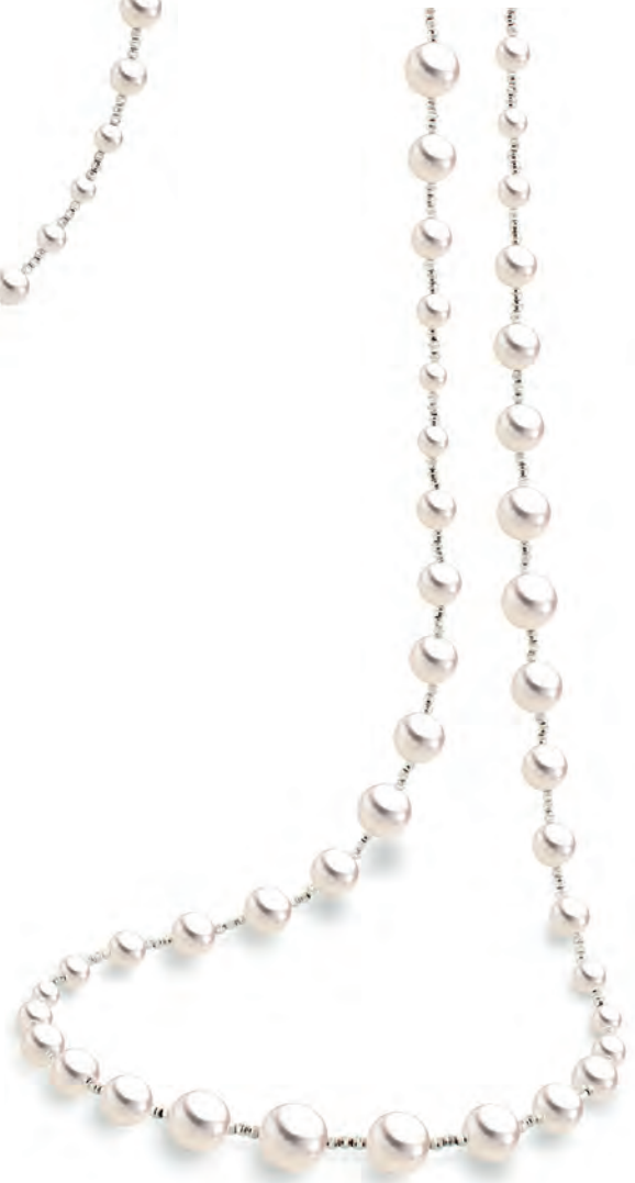
• 03 216.0839 750/-WG Collier, Akoya-Zuchtperle, rund, weiß, 4 - 9 mm, Länge 100 cm