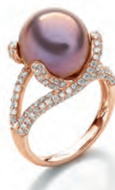
• 02 005.0951 750/-RG Ring, Süßwasser-Zuchtperle „Ming“, rund, natürliche Farbe, 12,5 - 13 mm, 180 Brillanten H/SI 1,26 ct.