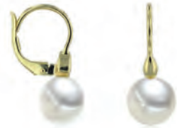
●07 311.1881 585/-GG Ohrhänger, Süßwasser-Zuchtperle, Bouton, weiß, 7,5 - 8 mm