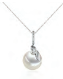
● 06 202.1623 750/-WG Anhänger, Süßwasser-Zuchtperle, rund, weiß, 9 - 10 mm, 1 Brillant H/SI 0,01 ct.