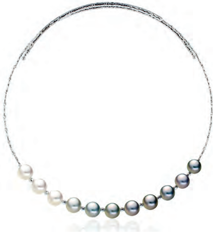
● 01 216.0727 750/-WG Collier, Tahiti-Zuchtperle, rund, multicolour, 9 - 10 mm