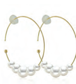
•03 311.2016 750/-GG Creole, Süßwasser-Zuchtperle, semi rund, weiß, 5 - 7 mm