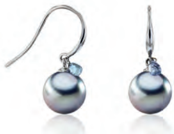
• 01 313.0588 585/-WG Ohrhaken, Tahiti-Zuchtperle, rund, grau, 9,5 - 10 mm blauer Saphir