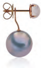
•01 311.1996 750/-RG Ohrhänger, Süßwasser-Zuchtperle „Ming“, rund, natürliche Farbe, 11 - 13 mm, Rosenquarz