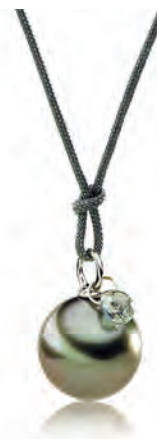
● 03 204.1379 750/-WG Anhänger, Tahiti-Zuchtperle, rund, grün, 10 - 11 mm grüner Saphir