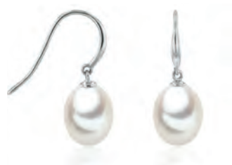
• 07 311.1579 585/-WG Ohrhaken, Süßwasser-Zuchtperle, Tropfen, weiß, 9 - 9,5 mm