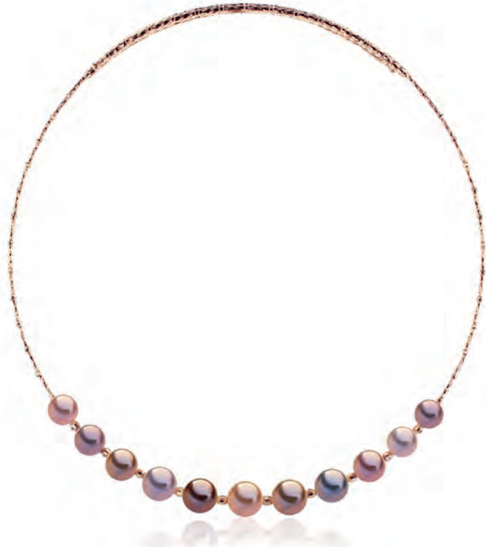
• 03 216.0853 750/-RG Collier, Süßwasser-Zuchtperle „Ming“, rund, multicolour, 10 - 12 mm