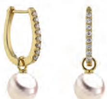
•03 312.1596 750/-GG Creole, Akoya-Zuchtperle, rund, weiß, 8,5 - 9 mm, 16 Brillanten H/SI 0,25 ct.