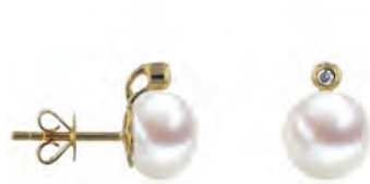
● 13 312.1236 585/-GG Ohrstecker, Süßwasser-Zuchtperle, Bouton, weiß, 8 - 8,5 mm 2 Brillanten H/SI 0,03 ct.