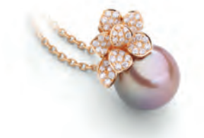
● 04 202.1474 750/-RG Anhänger, Süßwasser-Zuchtperle „Ming“, rund, natürliche Farbe, 11,5 - 12 mm, 53 Brillanten H/SI 0,35 ct.