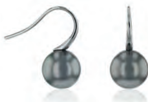
● 02 313.0399 750/-WG Ohrhaken, Tahiti-Zuchtperle, rund, grau, 10,5 - 11 mm