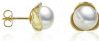
• 11 311.1961 585/-GG Ohrstecker, Süßwasser-Zuchtperle, Bouton, weiß, 8,5 - 9 mm