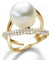
• 09 005.1004 750/-GG Ring, Südsee-Zuchtperle, rund, weiß, 11 - 12 mm, 67 Brillanten H/SI 0,69 ct.