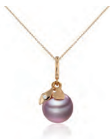
● 03 202.1621 750/-RG Anhänger, Süßwasser-Zuchtperle „Ming“, rund, natürliche Farbe, 9 - 10 mm, 1 Brillant H/SI 0,01 ct.