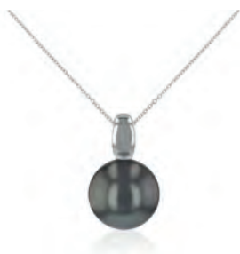
● 04 204.1405 750/-WG Anhänger, Tahiti-Zuchtperle, rund, grau, 9,5 - 10 mm