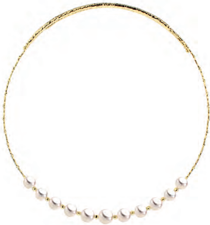
• 01 216.0728 750/-GG Collier, Akoya-Zuchtperle, rund, weiß, 7 - 9 mm