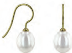
• 06 311.0682 585/-GG Ohrhaken, Süßwasser-Zuchtperle, Tropfen, weiß, 7,5 - 8 mm