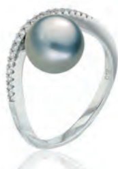
• 11 005.1036 585/-WG Ring, Tahiti-Zuchtperle, rund, grau, 8 - 9 mm, 20 Brillanten H/SI 0,12 ct.