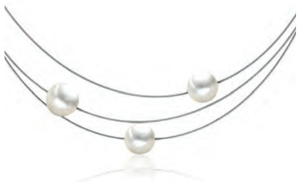
• 04 216.0671 Stahl Halsreif 3-reihig, Akoya-Zuchtperle, rund, weiß, 8 - 8,5 mm, Länge 45 cm