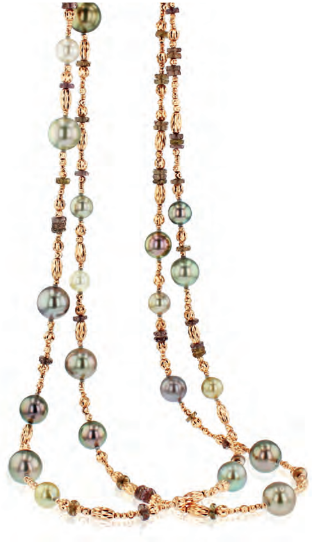
• 02 216.0723 750/-RG Collier, Tahiti-Zuchtperle, rund, multicolour, 7 - 12 mm, Länge 100 cm