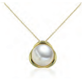
• 04 204.1402 585/-GG Anhänger, Süßwasser-Zuchtperle, semi rund, weiß, 7 - 8 mm