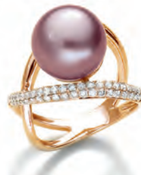
• 10 005.0964 750/-RG Ring, Süßwasser-Zuchtperle „Ming“, rund, natürliche Farbe, 12 - 13 mm, 67 Brillanten H/SI 0,69 ct.