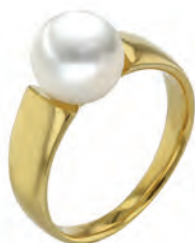
• 07 008.0592 585/-GG Ring, Süßwasser-Zuchtperle, rund, weiß, 8,5 - 9 mm