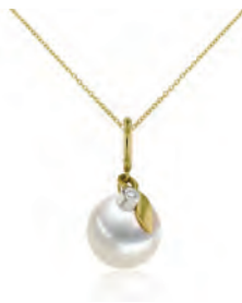
● 05 202.1622 750/-GW Anhänger, Süßwasser-Zuchtperle, rund, weiß, 9 - 10 mm, 1 Brillant H/SI 0,01 ct.