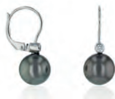
• 03 313.0572 750/-WG Ohrhänger, Tahiti-Zuchtperle, rund, grau, 9 - 9,5 mm, 2 Brillanten H/SI 0,10 ct.