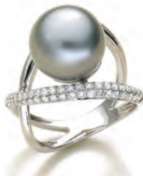
• 07 005.0939 750/-WG Ring, Tahiti-Zuchtperle, rund, grau, 12 - 12,5 mm, 67 Brillanten H/SI 0,69 ct.