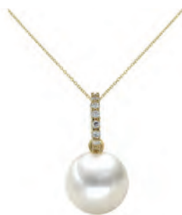
• 09 202.1596 750/-GG Anhänger, Süßwasser-Zuchtperle, rund, weiß, 9,5 - 10 mm, 8 Brillanten H/SI 0,08 ct.