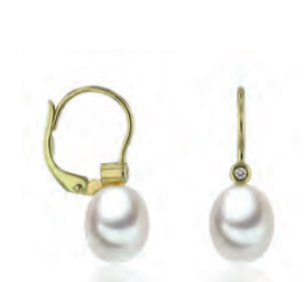
● 11 312.1539 585/-GG Ohrhänger, Süßwasser-Zuchtperle, Tropfen, weiß, 7,5 - 8 mm 2 Brillanten H/SI 0,02 ct.