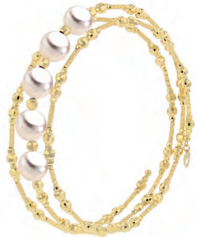
• 02 104.0429 750/-GG Armreif, Akoya-Zuchtperle, rund, weiß, 7,5 - 8 mm