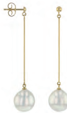
• 13 311.1957 750/-GG Ohrhänger, Süßwasser-Zuchtperle „Ming“, Tropfen, weiß, 10 - 11 mm