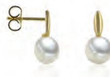
● 04 311.1964 585/-GG Ohrstecker, Süßwasser-Zuchtperle, Bouton, weiß, 6,5 - 7 mm