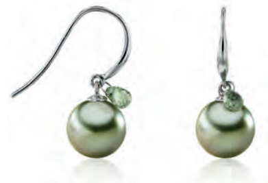
• 05 313.0594 585/-WG Ohrhaken, Tahiti-Zuchtperle, rund, grün, 9,5 - 10 mm grüner Saphir