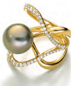
• 05 005.1067 750/-GG Ring, Tahiti-Zuchtperle, rund, grün, 11,5 - 12 mm, 43 Brillanten H/SI 0,64 ct.