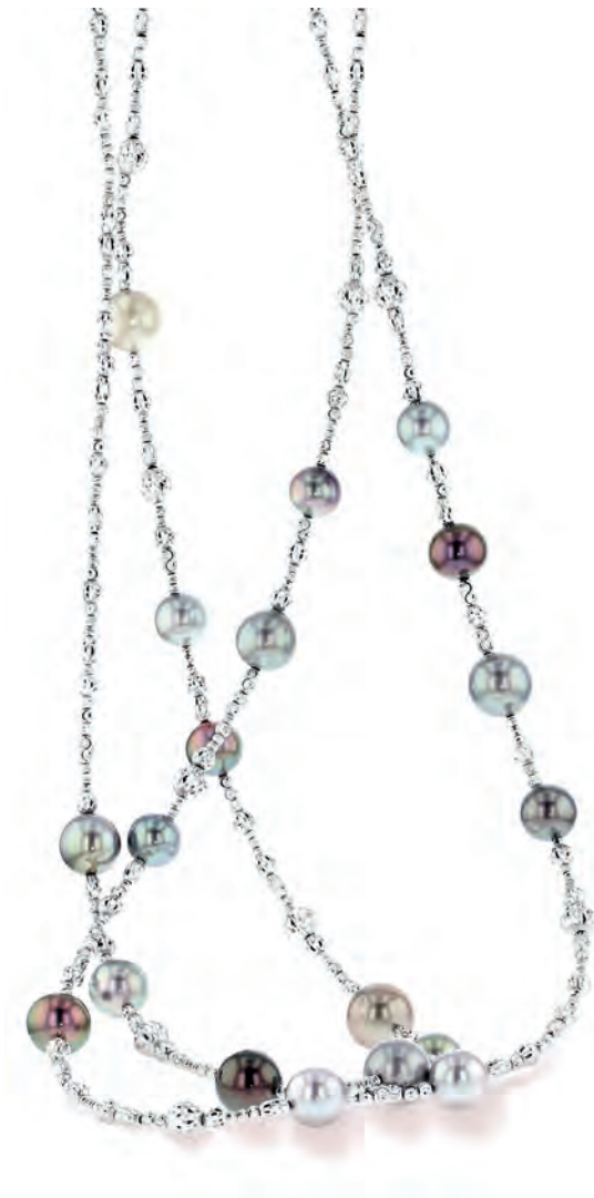
• 01 216.0682 750/-WG Collier, Tahiti-Zuchtperle, rund, multicolour, 9 - 11 mm, Länge 100 cm