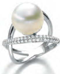
• 08 005.0962 750/-WG Ring, Südsee-Zuchtperle, rund, weiß, 12 - 13 mm, 67 Brillanten H/SI 0,69 ct.