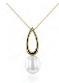
● 09 204.1390 585/-GG Anhänger, Süßwasser-Zuchtperle, Tropfen, weiß, 8 - 8,5 mm