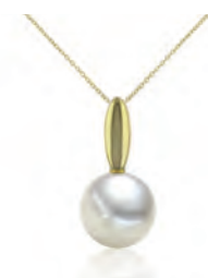
● 03 204.1375 585/-GG Anhänger, Süßwasser-Zuchtperle, Bouton, weiß, 8,5 - 9 mm