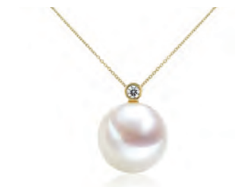
● 17 202.0701 585/-GG Anhänger, Süßwasser-Zuchtperle, Bouton, weiß, 11,5 - 12 mm 1 Brillant H/SI 0,04 ct.