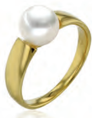
• 01 008.0590 585/-GG Ring, Süßwasser-Zuchtperle, rund, weiß, 7,5 - 8 mm