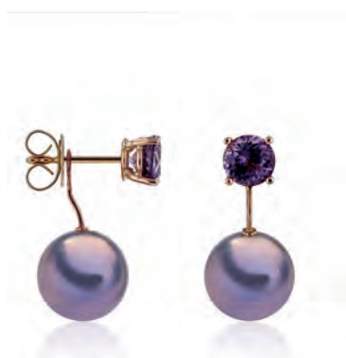
•06 311.2003 750/-RG Ohrhänger, Süßwasser-Zuchtperle „Ming“, rund, natürliche Farbe, 11 - 12 mm, Spinell 1,55 ct.