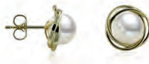
• 14 311.1749 585/-GG Ohrstecker, Süßwasser-Zuchtperle, Bouton, weiß, 7,5 - 8 mm