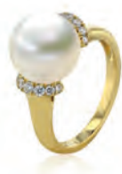
●04 005.1063 750/-GG Ring, Südsee-Zuchtperle, rund, weiß, 10 - 11 mm, 14 Brillanten H/SI 0,20 ct.