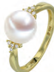
• 07 005.1057 585/-GG Ring, Süßwasser-Zuchtperle, Bouton, weiß, 9 - 9,5 mm, 8 Brillanten H/SI 0,05 ct.