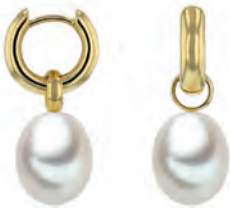
●04 311.1784 585/-GG Creole, Süßwasser-Zuchtperle, Tropfen, weiß, 9 - 9,5 mm