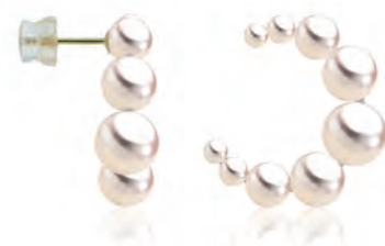
• 06 310.0828 750/-GG Ohrhänger, Akoya-Zuchtperle, rund, weiß, 3 - 8 mm