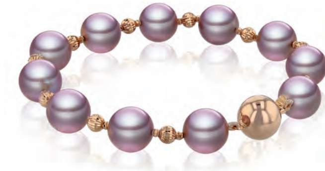
• 02 104.0555 750/-RG Armband, Süßwasser-Zuchtperle „Ming“, rund, natürliche Farbe, 9 - 10 mm, Länge 18 cm