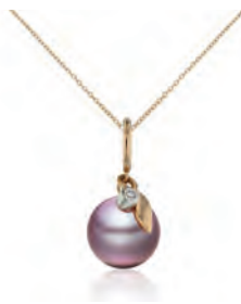
● 07 202.1625 750/-RW Anhänger, Süßwasser-Zuchtperle „Ming“, rund, natürliche Farbe, 9 - 10 mm, 1 Brillant H/SI 0,01 ct.