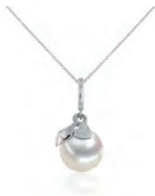
● 02 202.1619 750/-WG Anhänger, Süßwasser-Zuchtperle, rund, weiß, 9 - 10 mm, 1 Brillant H/SI 0,01 ct.