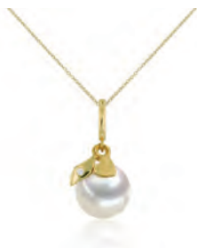
● 01 202.1618 750/-GG Anhänger, Süßwasser-Zuchtperle, rund, weiß, 9 - 10 mm, 1 Brillant H/SI 0,01 ct.