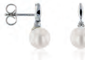
●11 312.1461 585/-WG Ohrstecker, Süßwasser-Zuchtperle, rund, weiß, 6 - 6,5 mm, 2 Brillanten H/SI 0,04 ct.