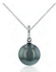
• 05 202.0835 750/-WG Anhänger, Tahiti-Zuchtperle, rund, grau, 8 - 9 mm, 6 Brillanten H/SI 0,02 ct.