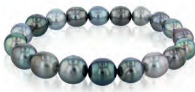
● 08 104.0545 Armband, Tahiti-Zuchtperle, semi rund, multi, 8 - 10 mm, elastisch aufgezogen