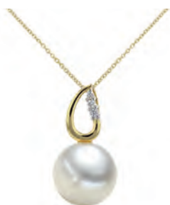
• 05 202.1594 585/-GG Anhänger, Süßwasser-Zuchtperle, Bouton, weiß, 10 - 10,5 mm, 3 Brillanten H/SI 0,03 ct.