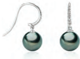
• 02 313.0609 750/-WG Ohrhaken, Tahiti-Zuchtperle, rund, grau, 9,5 - 10 mm, 10 Brillanten H/SI 0,04 ct.