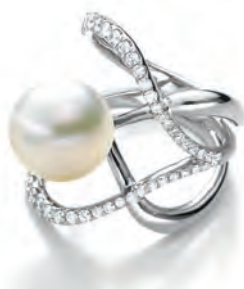
• 04 005.1019 750/-WG Ring, Südsee-Zuchtperle, rund, weiß, 11 - 12 mm, 43 Brillanten H/SI 0,64 ct.