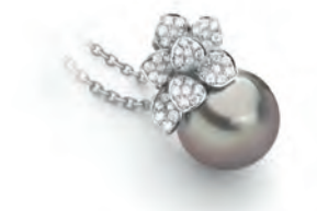
● 07 202.1475 750/-WG Anhänger, Tahiti-Zuchtperle, rund, grau, 12 - 13 mm, 53 Brillanten H/SI 0,35 ct.