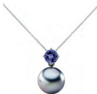
•05 204.1418 750/-WG Anhänger, Tahiti-Zuchtperle, rund, grau, 11 - 11,5 mm, Tansanit 0,83 ct.