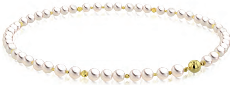
• 01 216.0850 750/-GG Collier, Akoya-Zuchtperle, rund, weiß, 7 - 7,5 mm, Länge 45 cm