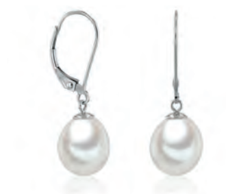
• 11 311.1693 585/-WG Ohrhaken, Süßwasser-Zuchtperle, Tropfen, weiß, 9,5 - 10 mm