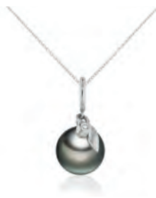
● 08 202.1624 750/-WG Anhänger, Tahiti-Zuchtperle, „Ming“, grau, 9 - 10 mm, 1 Brillant H/SI 0,01 ct.