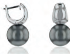
● 05 313.0531 585/-WG Creole, Tahiti-Zuchtperle, rund, grau, 9 - 10 mm