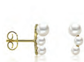
•06 311.2040 585/-GG Ohrstecker, Süßwasser-Zuchtperle, rund, weiß, 3 - 4 mm