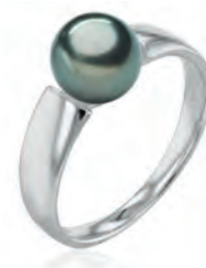
• 05 008.0602 585/-WG Ring, Tahiti-Zuchtperle, rund, grau, 8 - 8,5 mm