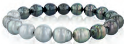
● 06 104.0519 Armband, Tahiti-Zuchtperle, barock, multi, 8 - 10 mm, elastisch aufgezogen