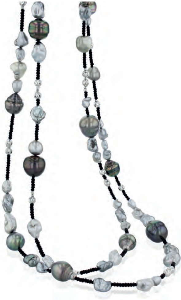
• 01 216.0669 750/-WG Collier, Tahiti-Zuchtperle, Keshi & circled, multicolour, 5 - 11 mm, schwarzer Spinell, Länge 110 cm