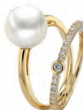
• 02 005.1002 585/-GG Ring, Süßwasser-Zuchtperle, rund, weiß, 9 - 9,5 mm, 20 Brillanten H/SI 0,176 ct.