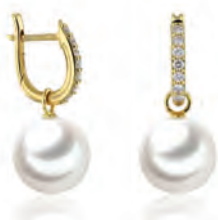
●01 314.0321 750/-GG Creole, Südsee-Zuchtperle, rund, weiß, 11 - 12 mm, 14 Brillanten H/SI 0,29 ct.