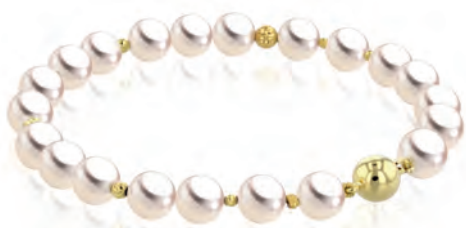
• 02 104.0556 750/-GG Armband, Akoya-Zuchtperle, rund, weiß, 7 - 7,5 mm, Länge 19 cm