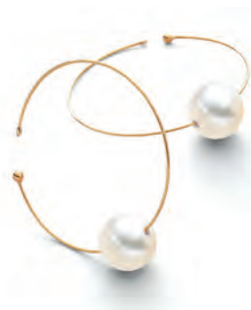
•02 311.1790 750/-GG Creole, Süßwasser-Zuchtperle „Ming“, rund, weiß, 10 - 11 mm