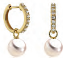
•01 312.1594 750/-GG Creole, Akoya-Zuchtperle, rund, weiß, 8 - 8,5 mm, 16 Brillanten H/SI 0,23 ct.