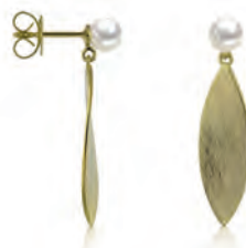
● 02 311.2039 585/-GG Ohrstecker, Süßwasser-Zuchtperle, Bouton, weiß, 5,5 - 6 mm