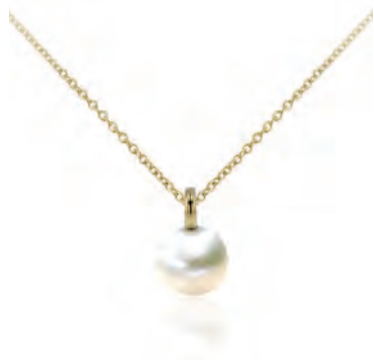
●04 204.1334 750/-GG Anhänger, Süßwasser-Zuchtperle „Ming“, rund, weiß, 7,5 - 8 mm