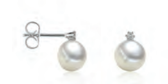
● 05 312.1549 585/-WG Ohrstecker, Süßwasser-Zuchtperle, Bouton, weiß, 7,5 - 8 mm, 2 Brillanten H/SI 0,10 ct.