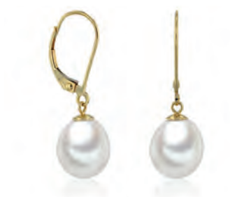
• 09 311.1692 585/-GG Ohrhaken, Süßwasser-Zuchtperle, Tropfen, weiß, 9,5 - 10 mm