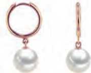
●03 311.1723 750/-RG Creole, Süßwasser-Zuchtperle, rund, weiß, 6,5 - 7 mm