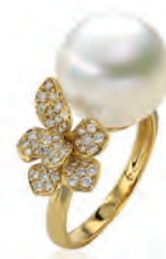
● 03 005.1062 750/-GG Ring, Südsee-Zuchtperle, semi rund, weiß, 12 - 13 mm, 52 Brillanten H/SI 0,32 ct.