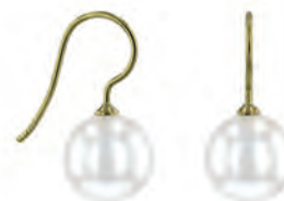
• 05 311.0694 585/-GG Ohrhaken, Süßwasser-Zuchtperle, rund, weiß, 9 - 9,5 mm