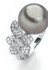
● 09 005.0996 750/-WG Ring, Tahiti-Zuchtperle, rund, grau, 12 - 13 mm, 52 Brillanten H/SI 0,32 ct.