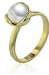
• 08 008.0586 585/-GG Ring, Süßwasser-Zuchtperle, semi rund, weiß, 7 - 8 mm