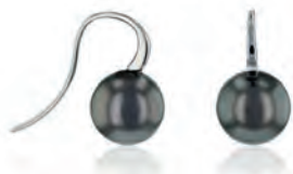
● 01 313.0420 750/-WG Ohrhaken, Tahiti-Zuchtperle, rund, grau, 8 - 9 mm