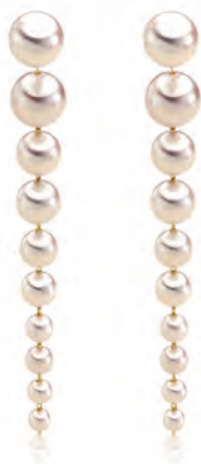
• 04 310.0813 750/-GG Ohrhänger, Akoya-Zuchtperle, rund, weiß, 3 - 8 mm