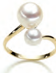
● 05 008.0455 585/-GG Ring, Süßwasser-Zuchtperle, rund, weiß, 6 - 9 mm