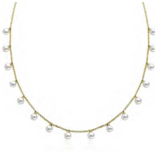
● 01 216.0708 585/-GG Collier, Süßwasser-Zuchtperle, rund, weiß, 4 - 5 mm Länge 45 cm