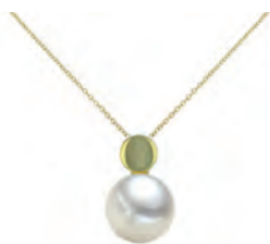
•07 204.1374 585/-GG Anhänger, Süßwasser-Zuchtperle, Bouton, weiß, 8,5 - 9 mm