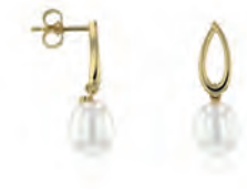
● 11 311.2009 585/-GG Ohrstecker, Süßwasser-Zuchtperle, Tropfen, weiß, 7,5 - 8 mm