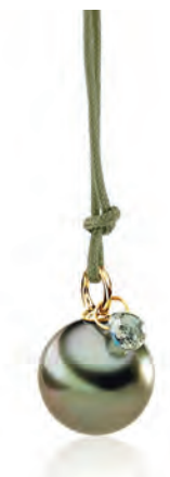
● 06 204.1394 750/-GG Anhänger, Tahiti-Zuchtperle, rund, grün, 10 - 11 mm grüner Saphir