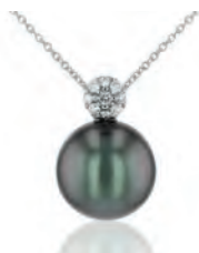
• 07 202.1497 585/-WG Anhänger, Tahiti-Zuchtperle, rund, grau, 9,5 - 10 mm, 9 Brillanten H/SI 0,14 ct.