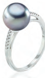
• 12 005.1037 750/-WG Ring, Tahiti-Zuchtperle, rund, grau, 9 - 10 mm, 12 Brillanten H/SI 0,06 ct.