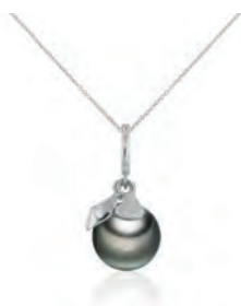
● 04 202.1620 750/-WG Anhänger, Tahiti-Zuchtperle, rund, grau, 9 - 10 mm, 1 Brillant H/SI 0,01 ct.