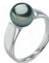
• 11 008.0604 585/-WG Ring, Tahiti-Zuchtperle, rund, grau, 8,5 - 9 mm