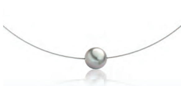
• 03 216.0653 Stahl Halsreif, Tahiti-Zuchtperle, rund, grau, 11 - 12 mm, Länge 45 cm