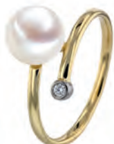
• 01 005.1029 585/-GG Ring, Süßwasser-Zuchtperle, Bouton, weiß, 8 - 8,5 mm, 1 Brillant H/SI 0,02 ct.