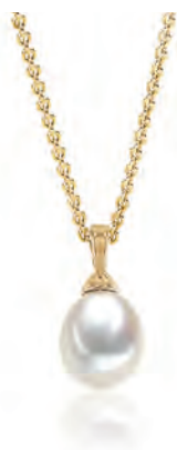
●07 204.1232 750/-GG Anhänger, Süßwasser-Zuchtperle, Tropfen, weiß, 8 - 8,5 mm