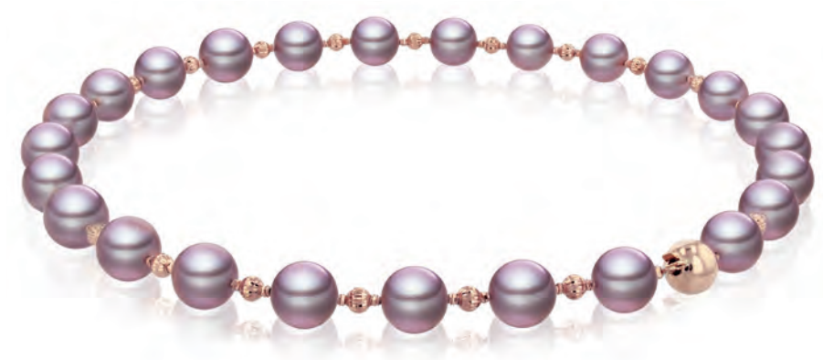
• 01 216.0849 750/-RG Collier, Süßwasser-Zuchtperle „Ming“, rund, natürliche Farbe, 10 - 11 mm, Länge 45 cm