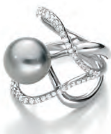
• 03 005.0998 750/-WG Ring, Tahiti-Zuchtperle, rund, grau, 11,5 - 12 mm, 43 Brillanten H/SI 0,64 ct.