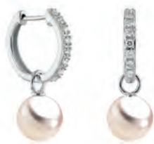
•02 312.1595 750/-WG Creole, Akoya-Zuchtperle, rund, weiß, 8 - 8,5 mm, 16 Brillanten H/SI 0,23 ct.