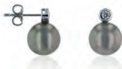
• 10 313.0236 750/-WG Ohrstecker, Tahiti-Zuchtperle, rund, grau, 8 - 9 mm, 2 Brillanten H/SI 0,04 ct.