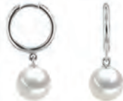
●02 311.1721 750/-WG Creole, Süßwasser-Zuchtperle, rund, weiß, 6,5 - 7 mm