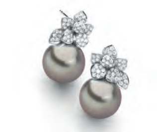
● 08 313.0524 750/-WG Ohrstecker, Tahiti-Zuchtperle, rund, grau, 11 - 12 mm, 98 Brillanten H/SI 0,50 ct.