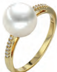
• 04 005.1061 750/-GG Ring, Süßwasser-Zuchtperle, rund, weiß, 9 - 9,5 mm, 12 Brillanten H/SI 0,06 ct.