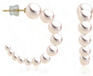
• 05 310.0827 750/-GG Creole, Akoya-Zuchtperle, rund, weiß, 3 - 8 mm