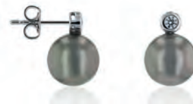
• 12 313.0235 750/-WG Ohrstecker, Tahiti-Zuchtperle, rund, grau, 9,5 - 10 mm, 2 Brillanten H/SI 0,12 ct.