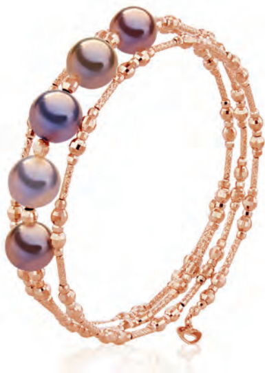
• 04 104.0554 750/-RG Armreif, Süßwasser-Zuchtperle „Ming“, rund, multicolour, 10 - 12 mm