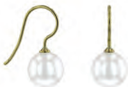
• 01 311.0692 585/-GG Ohrhaken, Süßwasser-Zuchtperle, rund, weiß, 8 - 8,5 mm