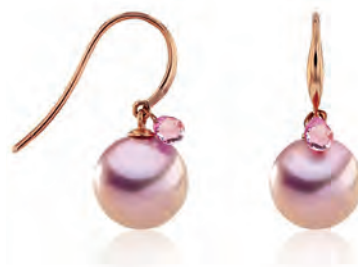
• 03 311.1998 585/-RG Ohrhaken, Süßwasser-Zuchtperle „Ming“, rund, natürliche Farbe, 10 - 11 mm pinker Saphir