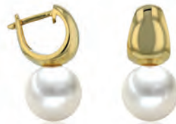
●06 311.1866 585/-GG Creole, Süßwasser-Zuchtperle, rund, weiß, 10 - 11 mm