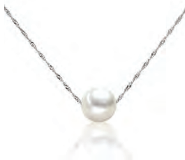
●02 216.0667 750/-WG Collier, Akoya-Zuchtperle, rund, weiß, 8,5 - 9 mm, Länge 40 cm