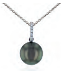
• 04 202.1536 750/-WG Anhänger, Tahiti-Zuchtperle, rund, grau, 10 - 11 mm, 8 Brillanten H/SI 0,08 ct.