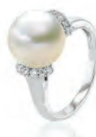
●05 005.1041 750/-WG Ring, Südsee-Zuchtperle, rund, weiß, 10 - 11 mm, 14 Brillanten H/SI 0,20 ct.