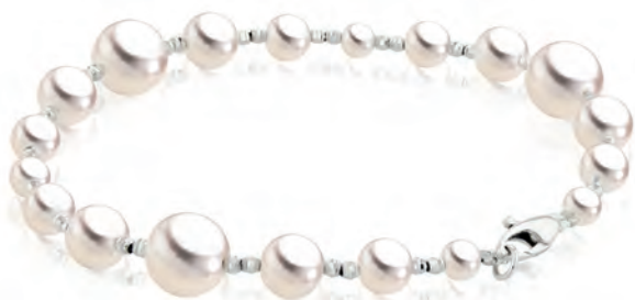
• 02 104.0557 750/-WG Armband, Akoya-Zuchtperle, rund, weiß, 4 - 8 mm, Länge 19 cm