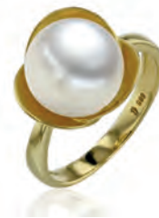
• 12 008.0564 585/-GG Ring, Süßwasser-Zuchtperle, Bouton, weiß, 10,5 - 11 mm