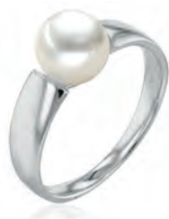
• 03 008.0591 585/-WG Ring, Süßwasser-Zuchtperle, rund, weiß, 7,5 - 8 mm