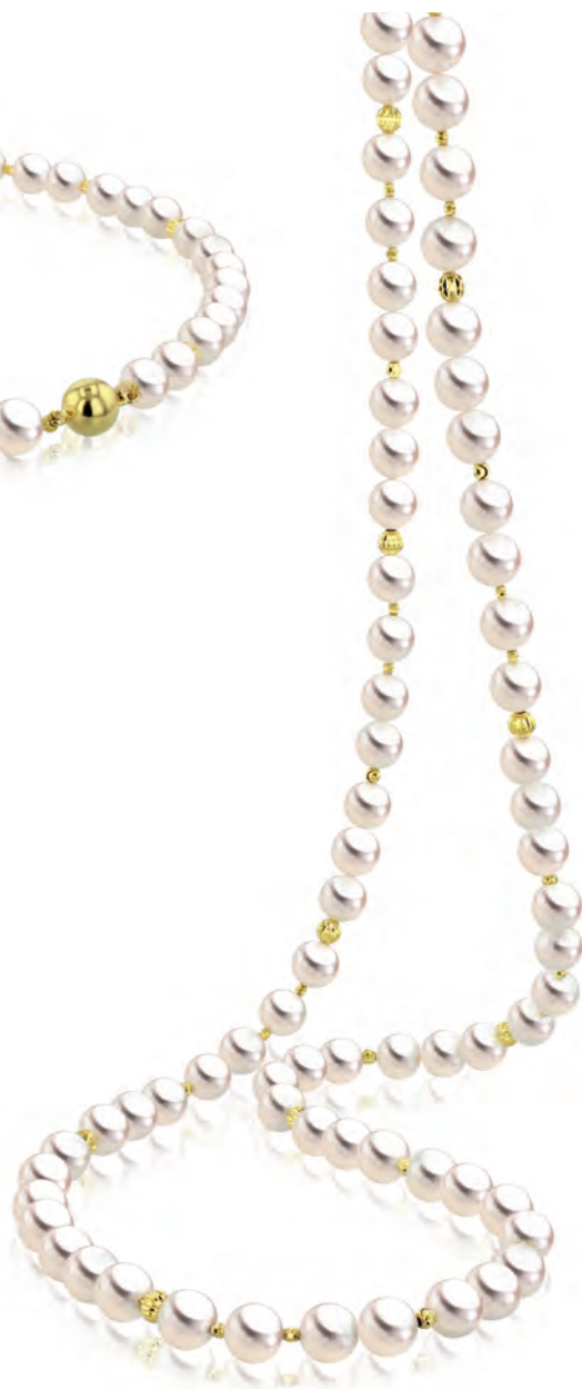
• 03 216.0851 750/-GG Collier, Akoya-Zuchtperle, rund, weiß, 7 - 7,5 mm, Länge 100 cm