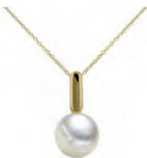
•04 204.1417 585/-GG Anhänger, Süßwasser-Zuchtperle, Bouton, weiß, 8,5 - 9 mm