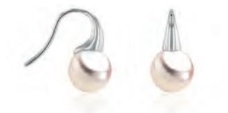
• 02 310.0812 750/-WG Ohrhaken, Akoya-Zuchtperle, rund, weiß, 8 - 8,5 mm