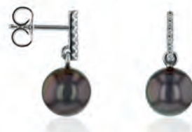
• 06 313.0549 750/-WG Ohrstecker, Tahiti-Zuchtperle, rund, grau, 8 - 9 mm, 12 Brillanten H/SI 0,06 ct.