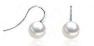
• 04 311.1659 750/-WG Ohrhaken, Süßwasser-Zuchtperle, rund, weiß, 8 - 8,5 mm