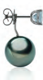
•03 313.0601 750/-GG Ohrhänger, Tahiti-Zuchtperle, rund, grau, 10 - 11 mm, grüner Saphir 0,98 ct..