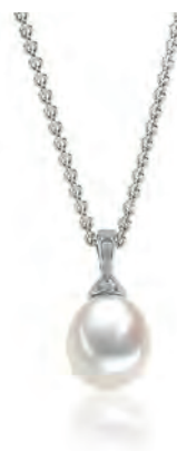
●08 204.1233 750/-WG Anhänger, Süßwasser-Zuchtperle, Tropfen, weiß, 8 - 8,5 mm