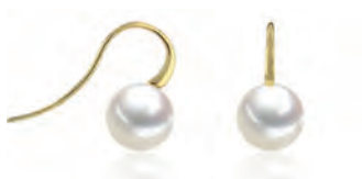
• 03 311.1660 750/-GG Ohrhaken, Süßwasser-Zuchtperle, rund, weiß, 8 - 8,5 mm