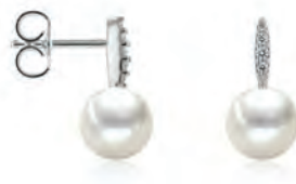
●07 312.1487 585/-WG Ohrstecker, Süßwasser-Zuchtperle, rund, weiß, 7 - 7,5 mm, 10 Brillanten H/SI 0,06 ct.