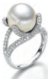
• 01 005.0952 750/-WG Ring, Südsee-Zuchtperle, rund, weiß, 12 - 12,5 mm, 180 Brillanten H/SI 1,26 ct.