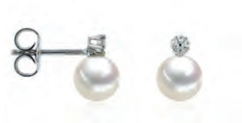
●03 312.1462 585/-WG Ohrstecker, Süßwasser-Zuchtperle, rund, weiß, 6 - 6,5 mm, 10 Brillanten H/SI 0,05 ct.