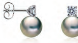
• 10 313.0607 750/-WG Ohrstecker, Tahiti-Zuchtperle, rund, grau, 9,5 - 10 mm, 2 Brillanten H/SI 0,50 ct.