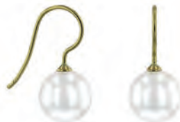
• 03 311.0693 585/-GG Ohrhaken, Süßwasser-Zuchtperle, rund, weiß, 8,5 - 9 mm