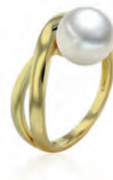
• 15 008.0585 585/-GG Ring, Süßwasser-Zuchtperle, Bouton, weiß, 8 - 8,5 mm