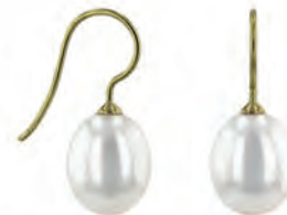
• 09 311.0686 585/-GG Ohrhaken, Süßwasser-Zuchtperle, Tropfen, weiß, 9,5 - 10 mm