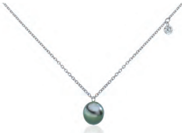
• 11 214.0349 750/-WG Collier, Tahiti-Zuchtperle, Tropfen, hellgrau, 8 - 9 mm, 1 Brillant H/SI 0,06 ct.