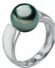
• 17 008.0608 585/-WG Ring, Tahiti-Zuchtperle, rund, grau, 10,5 - 11 mm