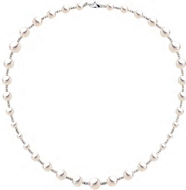
• 01 216.0840 750/-WG Collier, Akoya-Zuchtperle, rund, weiß, 4 - 9 mm, Länge 45 cm