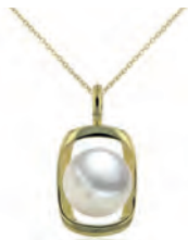
•01 204.1416 585/-GG Anhänger, Süßwasser-Zuchtperle, Bouton, weiß, 8,5 - 9 mm