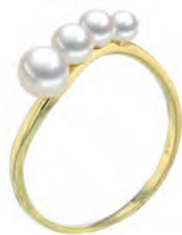
● 04 008.0553 585/-GG Ring, Süßwasser-Zuchtperle, rund, weiß, 3 - 5 mm