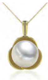
• 10 204.1372 585/-GG Anhänger, Süßwasser-Zuchtperle, Bouton, weiß, 10,5 - 11 mm