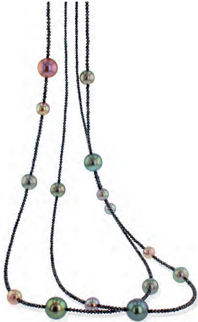
• 02 216.0733 750/-WG Collier, Tahiti- & Süßwasser-Zuchtperle „Ming“, rund, multicolour, 7 - 11 mm, schwarze Diamanten 13,0 ct., Länge 100 cm