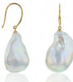
• 11 311.1955 750/-GG Ohrhaken, Süßwasser-Zuchtperle, barock, weiß, 13 - 14 mm