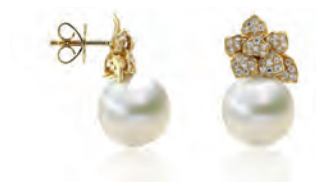
● 02 314.0319 750/-GG Ohrstecker, Südsee-Zuchtperle, rund, weiß, 11 - 12 mm, 98 Brillanten H/SI 0,50 ct.