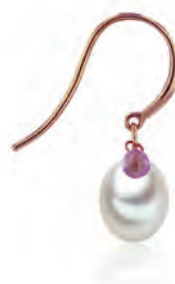
• 07 311.2012 585/-RG Ohrhaken, Süßwasser-Zuchtperle, Tropfen, weiß, 8 - 8,5 mm pinker Saphir