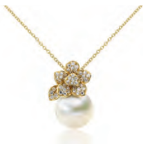
● 01 202.1593 750/-GG Anhänger, Südsee-Zuchtperle, rund, weiß, 11 - 12 mm, 53 Brillanten H/SI 0,35 ct.