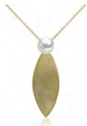
● 01 204.1414 585/-GG Anhänger, Süßwasser-Zuchtperle, Bouton, weiß, 5,5 - 6 mm