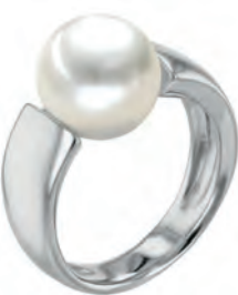
• 15 008.0607 585/-WG Ring, Süßwasser-Zuchtperle, rund, weiß, 10,5 - 11 mm