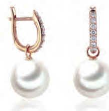
●03 314.0284 750/-RG Creole, Südsee-Zuchtperle, rund, weiß, 11 - 12 mm, 14 Brillanten H/SI 0,29 ct.