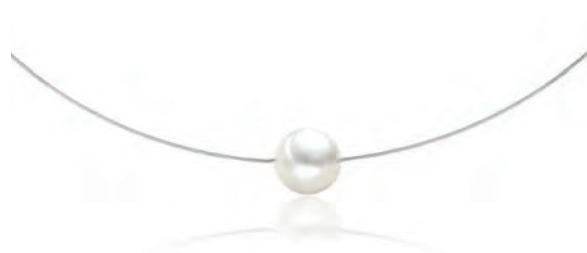
• 02 216.0670 Stahl Halsreif, Akoya-Zuchtperle, rund, weiß, 8 - 8,5 mm, Länge 45 cm