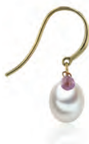
• 06 311.2026 585/-GG Ohrhaken, Süßwasser-Zuchtperle, Tropfen, weiß, 8 - 8,5 mm pinker Saphir