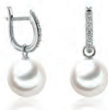
●02 314.0283 750/-WG Creole, Südsee-Zuchtperle, rund, weiß, 11 - 12 mm, 14 Brillanten H/SI 0,29 ct.