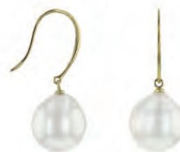
• 12 311.1956 750/-GG Ohrhaken, Süßwasser-Zuchtperle „Ming“, Tropfen, weiß, 10 - 11 mm