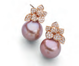
● 05 312.1521 750/-RG Ohrstecker, Süßwasser-Zuchtperle „Ming“, rund, natürliche Farbe, 11 - 12 mm, 98 Brillanten H/SI 0,50 ct.