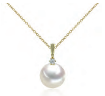
● 09 202.1635 585/-GG Anhänger, Süßwasser-Zuchtperle, Bouton, weiß, 8,5 - 9 mm 1 Brillant H/SI 0,03 ct.