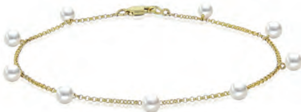
•01 104.0379 585/-GG Armband, Süßwasser-Zuchtperle, rund, weiß, 3 - 4 mm Länge 19 cm