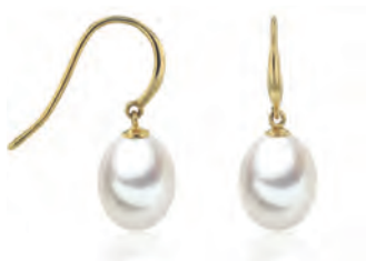
• 05 311.1580 585/-GG Ohrhaken, Süßwasser-Zuchtperle, Tropfen, weiß, 9 - 9,5 mm