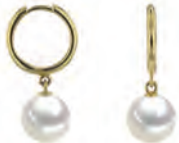
●01 311.1722 750/-GG Creole, Süßwasser-Zuchtperle, rund, weiß, 6,5 - 7 mm