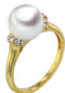
•07 005.1072 750/-GG Ring, Akoya-Zuchtperle, weiß, 9 - 9,5 mm, 10 Brillanten H/SI 0,13 ct.