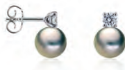
• 07 313.0604 750/-WG Ohrstecker, Tahiti-Zuchtperle, rund, grau, 8 - 8,5 mm, 2 Brillanten H/SI 0,20 ct.