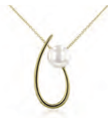
● 05 204.1389 585/-GG Anhänger, Süßwasser-Zuchtperle, Bouton, weiß, 8 - 8,5 mm