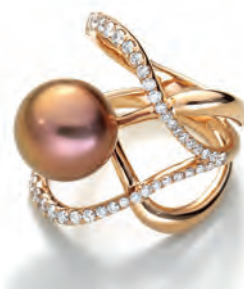
• 06 005.0940 750/-RG Ring, Süßwasser-Zuchtperle „Ming“, rund, natürliche Farbe, 11 - 12 mm, 43 Brillanten H/SI 0,64 ct.