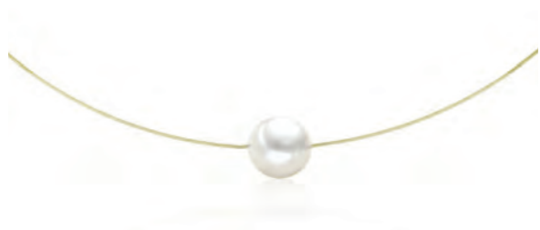
• 01 216.0848 750/-GG Halsreif, Süßwasser-Zuchtperle, rund, weiß, 9,5 - 10 mm, Länge 45 cm