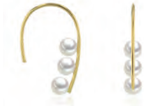
•05 311.1960 750/-GG Ohrhänger, Süßwasser-Zuchtperle, rund, weiß, 3,5 - 4 mm