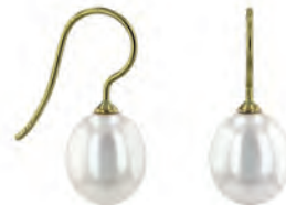
• 07 311.0684 585/-GG Ohrhaken, Süßwasser-Zuchtperle, Tropfen, weiß, 8,5 - 9 mm