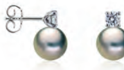
• 09 313.0606 750/-WG Ohrstecker, Tahiti-Zuchtperle, rund, grau, 9 - 9,5 mm, 2 Brillanten H/SI 0,40 ct.