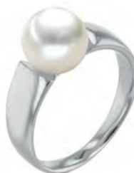
• 09 008.0593 585/-WG Ring, Süßwasser-Zuchtperle, rund, weiß, 8,5 - 9 mm