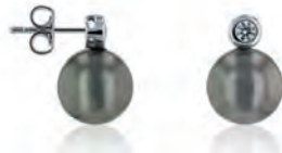
• 11 313.0230 750/-WG Ohrstecker, Tahiti-Zuchtperle, rund, grau, 8 - 9 mm, 2 Brillanten H/SI 0,10 ct.