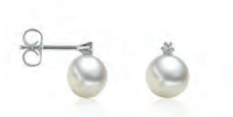
● 01 312.1503 585/-WG Ohrstecker, Süßwasser-Zuchtperle, Bouton, weiß, 6,5 - 7 mm, 2 Brillanten H/SI 0,05 ct.