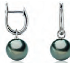
● 03 313.0608 750/-WG Creole, Tahiti-Zuchtperle, rund, grau, 10 - 10,5 mm