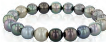
● 07 104.0562 Armband, Tahiti-Zuchtperle, rund, multi, 9 - 10 mm, elastisch aufgezogen