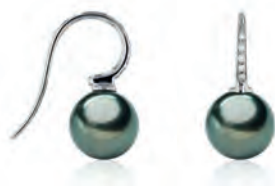
• 02 313.0571 750/-WG Ohrhaken, Tahiti-Zuchtperle, rund, grau, 8 - 9 mm, 10 Brillanten H/SI 0,045 ct.