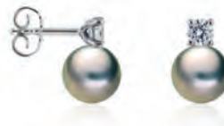
• 08 313.0605 750/-WG Ohrstecker, Tahiti-Zuchtperle, rund, grau, 8,5 - 9 mm, 2 Brillanten H/SI 0,30 ct.