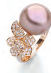
● 06 005.0995 750/-RG Ring, Süßwasser-Zuchtperle „Ming“, rund, natürliche Farbe, 12 - 13 mm, 52 Brillanten H/SI 0,32 ct.