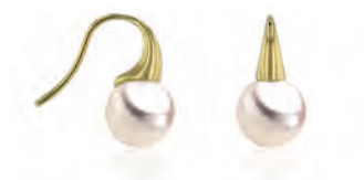
• 01 310.0811 750/-GG Ohrhaken, Akoya-Zuchtperle, rund, weiß, 8 - 8,5 mm