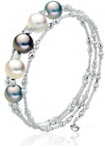
● 02 104.0496 750/-WG Armreif, Tahiti- & Südsee-Zuchtperle, rund, multicolour, 8 - 9 mm