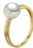
•06 008.0601 585/-GG Ring, Süßwasser-Zuchtperle, Bouton, weiß, 8 - 8,5 mm