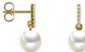
• 10 312.1598 750/-GG Ohrstecker, Süßwasser-Zuchtperle, rund, weiß, 8,5 - 9 mm, 12 Brillanten H/SI 0,06 ct.