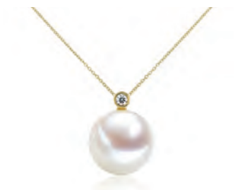
● 15 202.0700 585/-GG Anhänger, Süßwasser-Zuchtperle, Bouton, weiß, 9,5 - 10 mm 1 Brillant H/SI 0,02 ct.