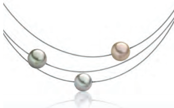
• 05 216.0654 Stahl Halsreif 3-reihig, Tahiti-Zuchtperle, rund, multicolour, 9 - 10 mm, Länge 45 cm