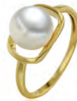
•03 008.0600 585/-GG Ring, Süßwasser-Zuchtperle, Bouton, weiß, 8,5 - 9 mm