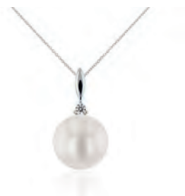
●09 202.1409 585/-WG Anhänger, Süßwasser-Zuchtperle, rund, weiß, 9 - 10 mm, 1 Brillant H/SI 0,04 ct.