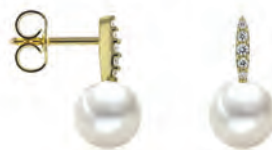
• 03 312.1431 585/-GG Ohrstecker, Süßwasser-Zuchtperle, rund, weiß, 7 - 7,5 mm, 10 Brillanten H/SI 0,06 ct.