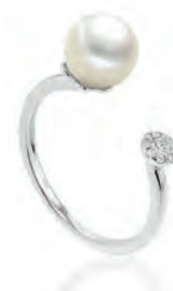
●05 005.0970 585/-WG Ring, Süßwasser-Zuchtperle, rund, weiß, 7,5 - 8 mm, 10 Brillanten H/SI 0,07 ct.