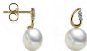
• 07 312.1601 585/-GG Ohrstecker, Süßwasser-Zuchtperle, Bouton, weiß, 8 - 8,5 mm, 6 Brillanten H/SI 0,03 ct.