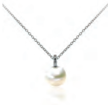
●05 204.1336 750/-WG Anhänger, Süßwasser-Zuchtperle „Ming“, rund, weiß, 7,5 - 8 mm