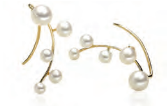
•04 311.1696 585/-GG Ohrhänger, Süßwasser-Zuchtperle, rund, weiß, 2,5 - 5,5 mm