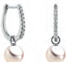
•04 312.1597 750/-WG Creole, Akoya-Zuchtperle, rund, weiß, 8,5 - 9 mm, 16 Brillanten H/SI 0,25 ct.