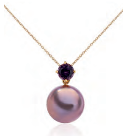
•07 204.1420 750/-RG Anhänger, Süßwasser-Zuchtperle „Ming“, rund, natürliche Farbe, 13 - 14 mm, Spinell 0,80 ct