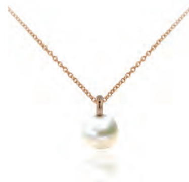
●06 204.1335 750/-RG Anhänger, Süßwasser-Zuchtperle „Ming“, rund, weiß, 7,5 - 8 mm