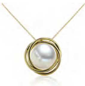
• 13 204.1401 585/-GG Anhänger, Süßwasser-Zuchtperle, Bouton, weiß, 10 - 11 mm