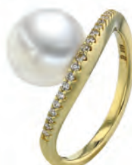
• 05 005.1051 585/-GG Ring, Süßwasser-Zuchtperle, Bouton, weiß, 9,5 - 10 mm, 20 Brillanten H/SI 0,12 ct.