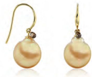
• 08 314.0338 750/-GG Ohrhaken, Südsee-Zuchtperle, Tropfen, gold, 12 - 13 mm brauner Diamant