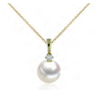
● 07 202.1633 585/-GG Anhänger, Süßwasser-Zuchtperle, Bouton, weiß, 8 - 8,5 mm 1 Brillant H/SI 0,05 ct.