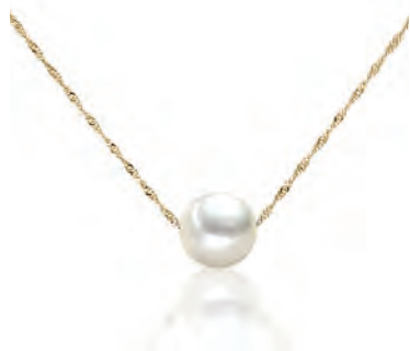
●01 216.0668 750/-GG Collier, Akoya-Zuchtperle, rund, weiß, 8,5 - 9 mm, Länge 40 cm