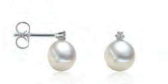
● 03 312.1505 585/-WG Ohrstecker, Süßwasser-Zuchtperle, Bouton, weiß, 7,5 - 8 mm, 2 Brillanten H/SI 0,07 ct.