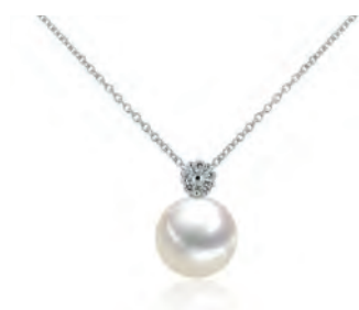
●01 202.1410 585/-WG Anhänger, Süßwasser-Zuchtperle, rund, weiß, 8 - 9 mm, 5 Brillanten H/SI 0,05 ct.