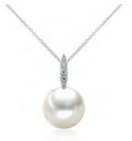
●06 202.1585 585/-WG Anhänger, Süßwasser-Zuchtperle, rund, weiß, 9 - 9,5 mm, 5 Brillanten H/SI 0,05 ct.