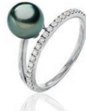
● 005.1092 750/-WG Ring, Tahiti-Zuchtperle, rund, grau, 8 - 8,5 mm, 21 Brillanten H/SI 0,23 ct.