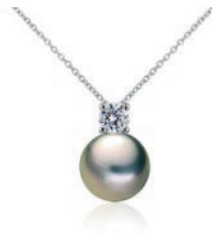
● 202.1675 750/-WG Anhänger, Tahiti-Zuchtperle, rund, grau, 8,5 - 9 mm, 1 Brillant H/SI 0,25 ct.