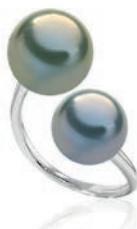
● 008.0516 585/-WG Ring, Tahiti-Zuchtperle, rund, multicolour, 9 - 12 mm