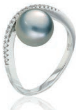
● 005.1036 585/-WG Ring, Tahiti-Zuchtperle, rund, grau, 8 - 9 mm, 20 Brillanten H/SI 0,12 ct.