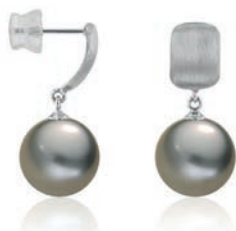
● 313.0633 750/-WG Ohrhänger, Tahiti-Zuchtperle, rund, grau, 10 - 11 mm