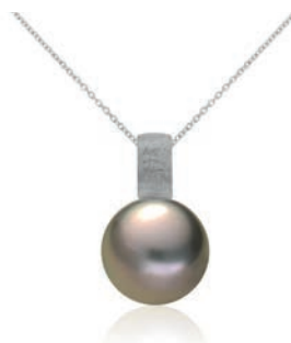
● 204.1456 750/-WG Anhänger, Tahiti-Zuchtperle, rund, grau, 12 - 13 mm