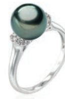
● 005.1093 750/-WG Ring, Tahiti-Zuchtperle, rund, grau, 9 - 9,5 mm, 10 Brillanten H/SI 0,13 ct.