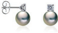
● 313.0604 750/-WG Ohrstecker, Tahiti-Zuchtperle, rund, grau, 8 - 8,5 mm, 2 Brillanten H/SI 0,20 ct.