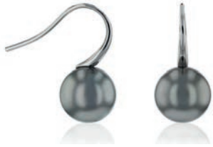
• 313.0399 750/-WG Ohrhaken, Tahiti-Zuchtperle, rund, grau, 10,5 - 11 mm