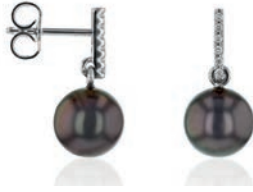
● 313.0549 750/-WG Ohrhänger, Tahiti-Zuchtperle, rund, grau, 8 - 9 mm, 12 Brillanten H/SI 0,06 ct.