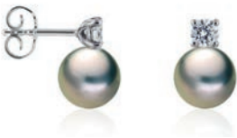
● 313.0605 750/-WG Ohrstecker, Tahiti-Zuchtperle, rund, grau, 8,5 - 9 mm, 2 Brillanten H/SI 0,30 ct.