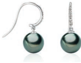
● 313.0609 750/-WG Ohrhaken, Tahiti-Zuchtperle, rund, grau, 9,5 - 10 mm, 10 Brillanten H/SI 0,04 ct.