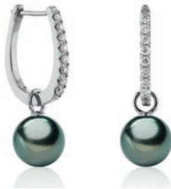
● 313.0586 750/-WG Creole, Tahiti-Zuchtperle, rund, grau, 9 - 9,5 mm, 16 Brillanten H/SI 0,25 ct.