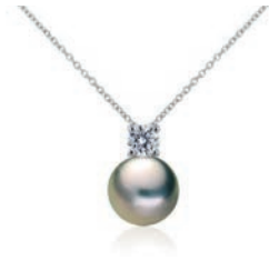
● 202.1674 750/-WG Anhänger, Tahiti-Zuchtperle, rund, grau, 8 - 8,5 mm, 1 Brillant H/SI 0,15 ct.