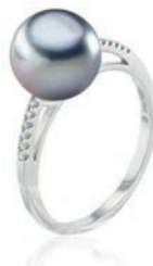
● 005.1037 750/-WG Ring, Tahiti-Zuchtperle, rund, grau, 9 - 10 mm, 12 Brillanten H/SI 0,06 ct.