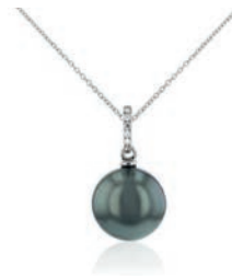
● 202.0835 750/-WG Anhänger, Tahiti-Zuchtperle, rund, grau, 8 - 9 mm, 6 Brillanten H/SI 0,02 ct.