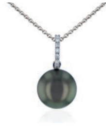
● 202.1536 750/-WG Anhänger, Tahiti-Zuchtperle, rund, grau, 10 - 11 mm, 8 Brillanten H/SI 0,08 ct.