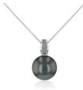
• 204.1405 750/-WG Anhänger, Tahiti-Zuchtperle, rund, grau, 9 - 10 mm