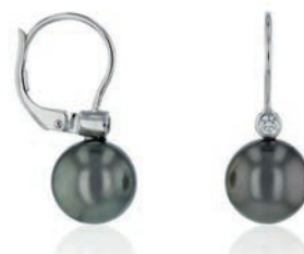
● 313.0572 750/-WG Ohrhänger, Tahiti-Zuchtperle, rund, grau, 9 - 9,5 mm, 2 Brillanten H/SI 0,10 ct.