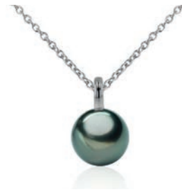
• 216.0945 750/-WG Collier, Tahiti-Zuchtperle, rund, grau, 11 - 12 mm, Länge 45 cm