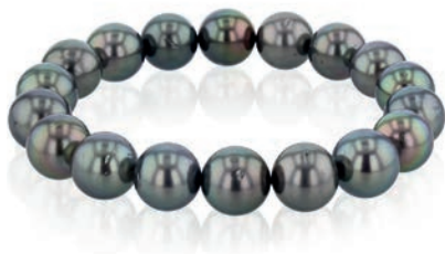
• 104.0590 Armband, Tahiti-Zuchtperle, rund, grau, 10 - 11 mm, elastisch aufgezogen