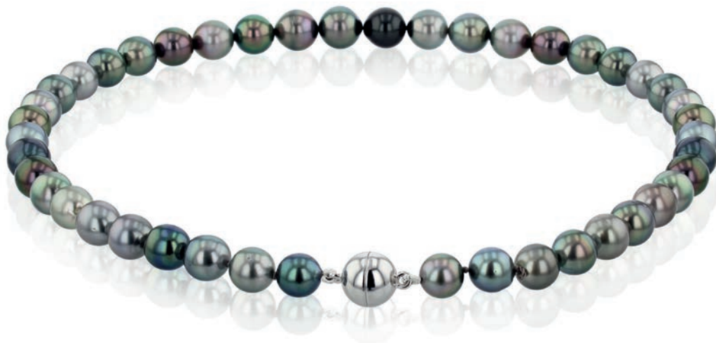
● 218.0245 585/-WG Collier, Tahiti-Zuchtperle, semi rund, multicolour, 8 - 11 mm, Länge 45 cm