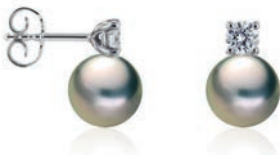
● 313.0606 750/-WG Ohrstecker, Tahiti-Zuchtperle, rund, grau, 9 - 9,5 mm, 2 Brillanten H/SI 0,40 ct.