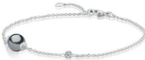
• 104.0609 750/-WG Armband, Tahiti-Zuchtperle, semi rund, grau, 9 - 10 mm, 1 Diamant 0,06 ct.