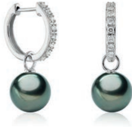
● 313.0581 750/-WG Creole, Tahiti-Zuchtperle, rund, grau, 11 - 11,5 mm, 16 Brillanten H/SI 0,23 ct.