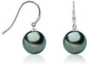
• 313.0635 750/-WG Ohrhaken, Tahiti-Zuchtperle, rund, grau, 10,5 - 11 mm