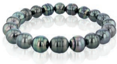
• 104.0418 Armband, Tahiti-Zuchtperle, barock, schwarz, 8 - 10 mm, elastisch aufgezogen