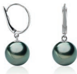
● 313.0637 585/-WG Ohrhänger, Tahiti-Zuchtperle, rund, grau, 10,5 - 11 mm