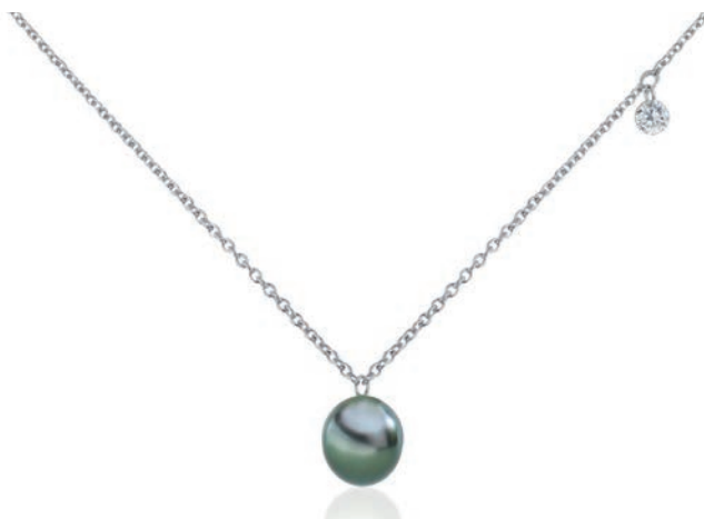
• 214.0349 750/-WG Collier, Tahiti-Zuchtperle, Tropfen, hellgrau, 8 - 9 mm, 1 Diamant 0,06 ct.