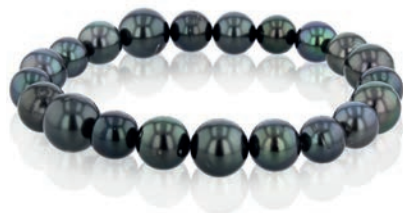
• 104.0617 Armband, Tahiti-Zuchtperle, semi rund, schwarz, 8 - 10 mm, elastisch aufgezogen