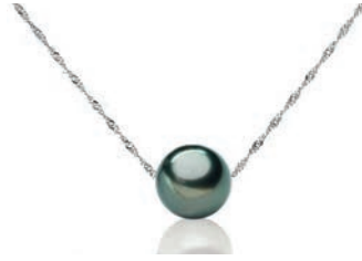
• 216.0938 750/-WG Collier, Tahiti-Zuchtperle, rund, grau, 8 - 9 mm, Länge 40 cm