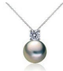
● 202.1676 750/-WG Anhänger, Tahiti-Zuchtperle, rund, grau, 9 - 9,5 mm, 1 Brillant H/SI 0,40 ct.