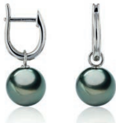
• 313.0608 750/-WG Creole, Tahiti-Zuchtperle, rund, grau, 10 - 10,5 mm